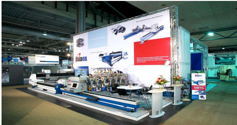
غرفه شرکت RADOX در نمایشگاه EuroBlech آلمان

RADOX با بهره گیری از تخصص و تجربه کارشناسان در سال 1377 با هدف تولید انواع دستگاه های CNC و طراحی و ساخت دستگاههای مخصوص ، تجهیزات خطوط تولید و جیک و فیکسچر شروع به فعالیت نمود. این شرکت به عنوان قطب اصلی تولید دستگاه های CNC در ایران و خاورمیانه ، موفق به تولید دستگاههای CNC RADOX , با بالاترین کیفیت و نازلترین قیمت شده است . RADOX به صورت OEM با شرکت های آمریکایی KMT , INGERSOLL LAND(USA) , HYPERTHERM و شرکتهای اروپایی از قبیل BFT ، GMA ، (GERMANY) KJELLBERG همکاری دارد که از شاخصترین کمپانی ها در این زمینه می باشند.